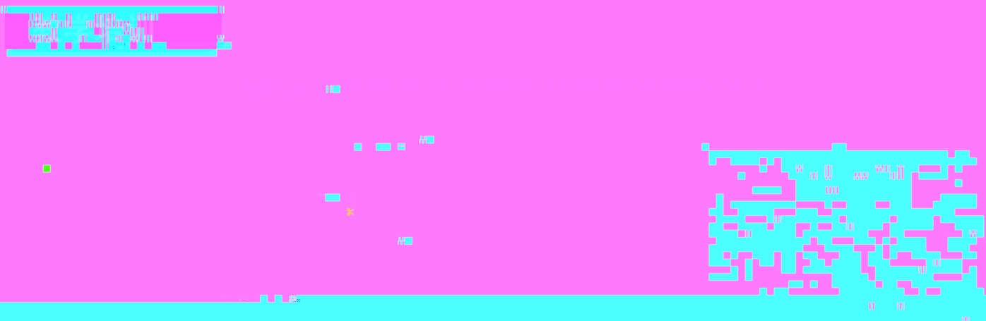
图1 论坛开幕式暨合影留念

指出，高等教育正在经历了从大众化向高等化转变。此外，本报告还回顾了高等教育在促进社会公平和包容性方面的作用，并探讨了高等教育在促进社会公平和包容性方面的作用。报告指出，高等教育在促进社会公平和包容性方面的作用日益凸显，特别是在发展中国家，高等教育被视为实现社会公平和包容性的关键途径。报告还探讨了高等教育在促进社会公平和包容性方面的作用，特别是在发展中国家，高等教育被视为实现社会公平和包容性的关键途径。